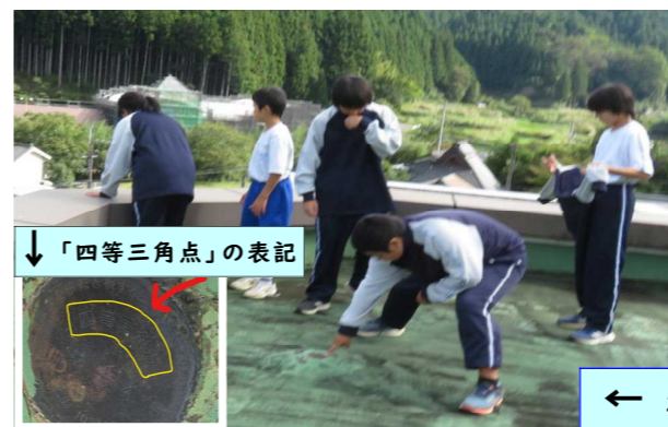
↓「四等三角点」の表記

中学1年生は社会科の学習で、村内各所にある「三角点」(国土交通省国土地理院が全国に設置した各地の標高を測る基準点)を実際に確認する学習に取り組みました。村役場の屋上や旧御杖小学校の敷地内など数カ所を巡り、見つけることが出来ました。「できれば村内にある三角点の全てを確認したい！」と強い意気込みの声が生徒からは上がっているようです。